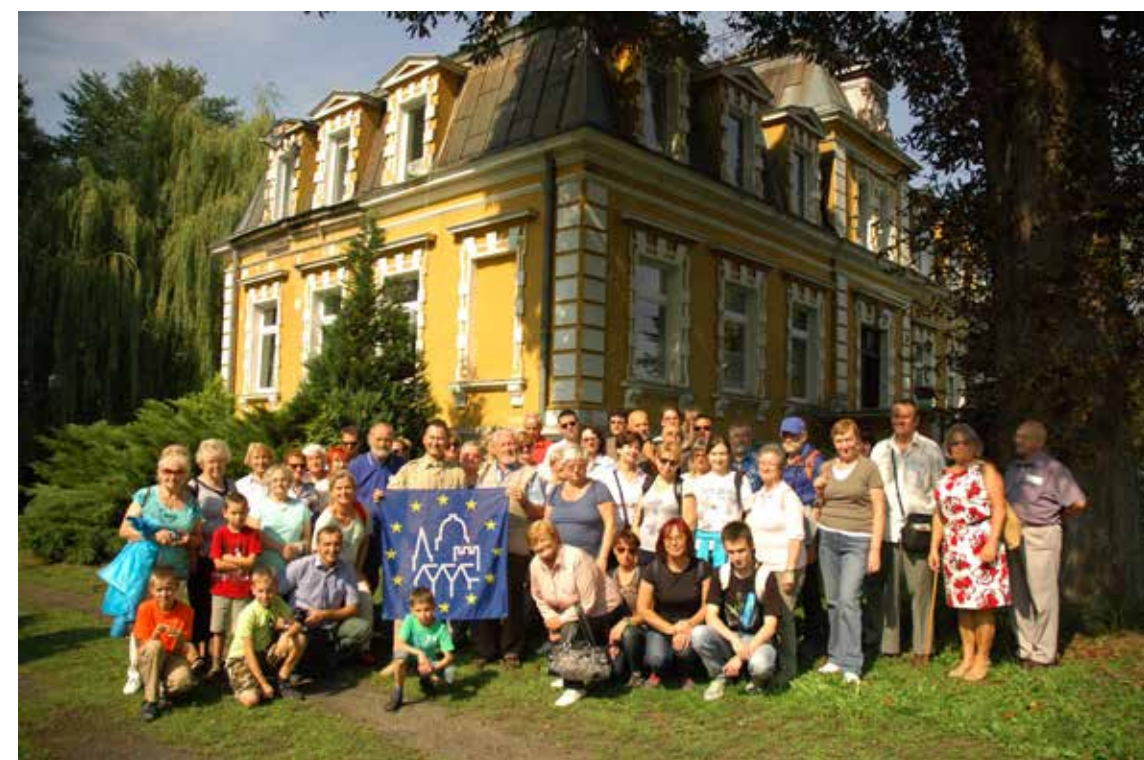
Podróż studyjna szlakiem otwartych zabytków. Budzistowo, 2014r.

Zachodniopomorskie uczestniczy w Europejskich Dniach Dziedzictwa od 2004 r. Corocznie imprezy w miastach i wsiach Pomorza Zachodniego przyciągają kilka