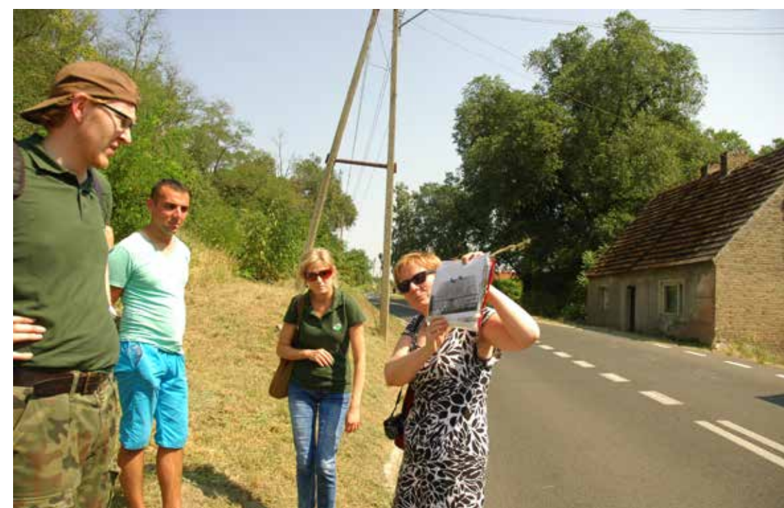
Warsztaty terenowe w Starym Kostrzynku, Gmina Cedynia, 14.08.2015

Biuro realizuje także długofalowe programy, zmierzające