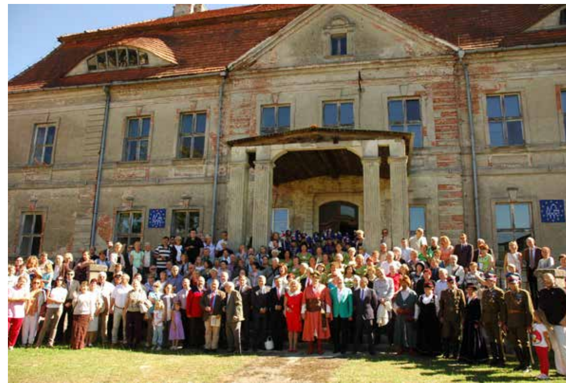
Uroczysta wojewódzka inauguracja EDD w Siemczynie, 2013r.

Na czerwowym spotkaniu sejmowej Komisji Kultury z przedstawicielami środowisk kultury w Akademii Sztuki w Szczecinie mówiono o mechanizmach budowania takich właśnie postaw tu na Pomorzu Zachodnim i potrzebie ich pogłębiania. Wskazywano na konieczność zwiększania dostępności do wydarzeń kulturalnych dla mieszkańców regionu, zwłaszcza dla tych, którzy z powodów ekonomicznych czy komunika-