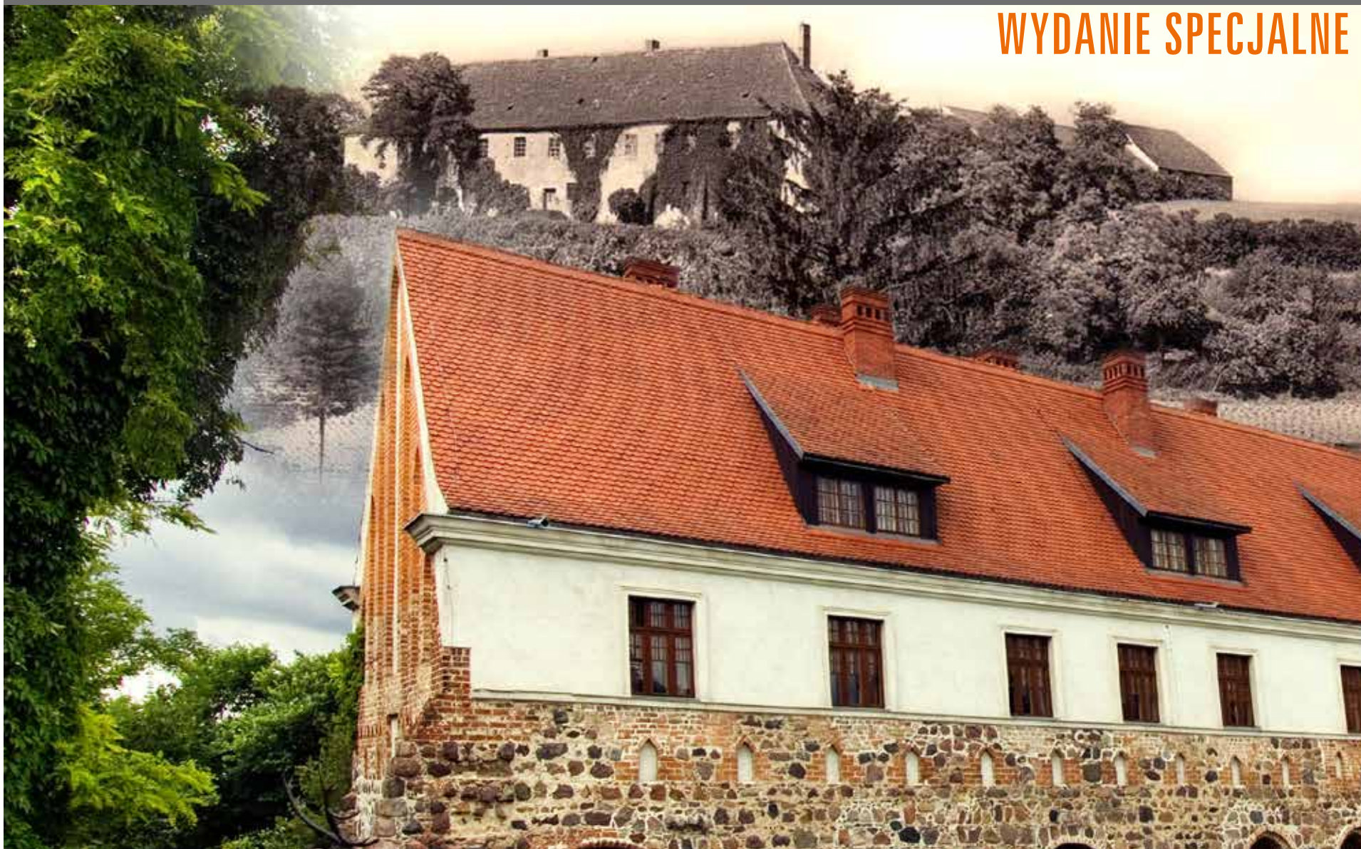
■ Pocysterski klasztor w Cedyni, fot. Michał Nieścioruk /archiwalne zdjęcie ze zb. B. Bogdanowicza/fotomontaż Dorota Lesiak